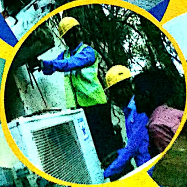
ए.सी फ्रीज टेक्निसियन